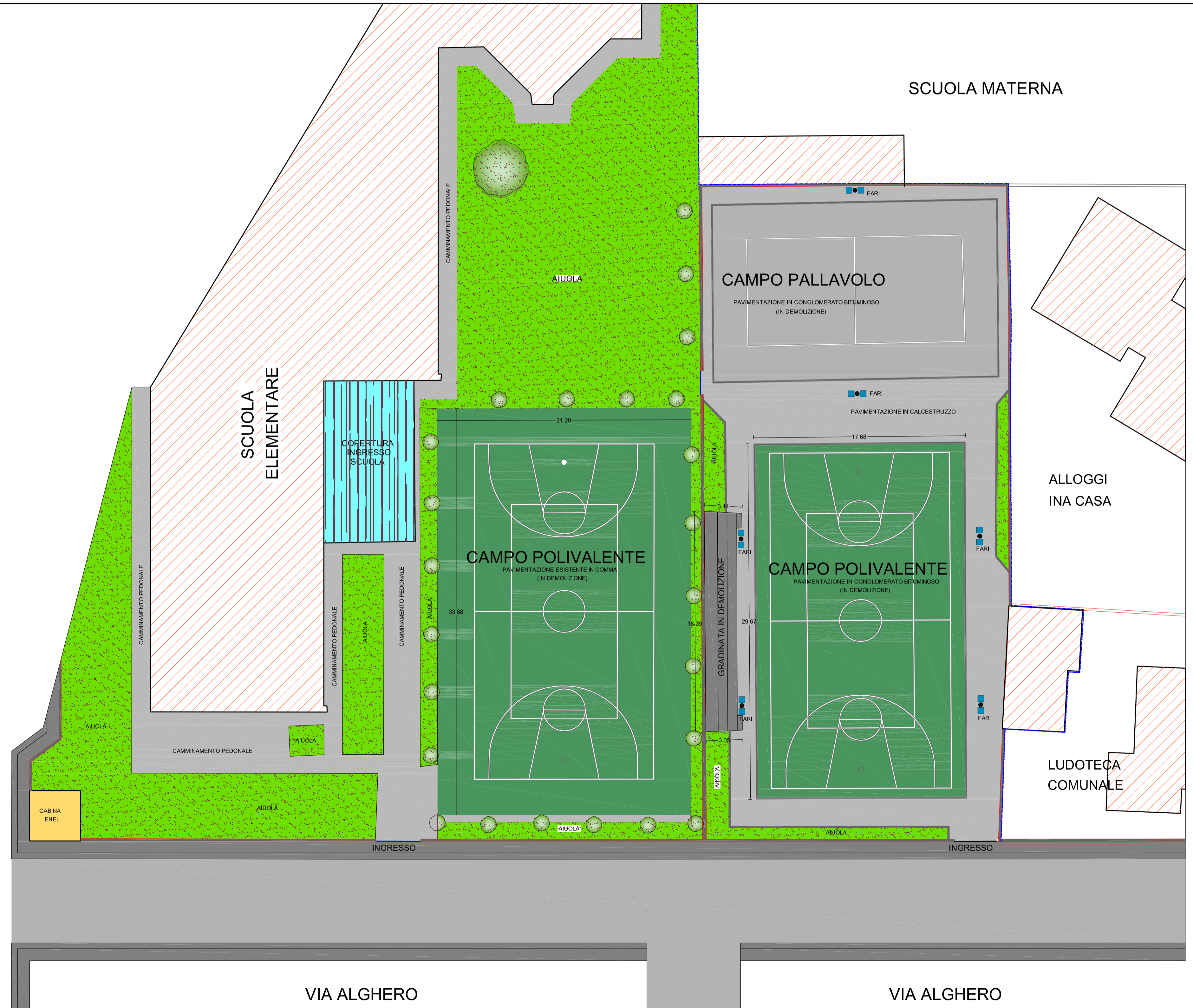
PLANIMETRIA GENERALE - Scala 1:200